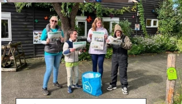
Zelfs de krantenwijk is gelopen..