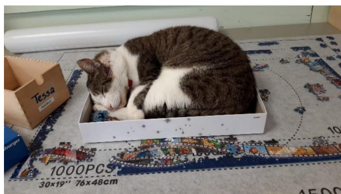
Zippy ligt het lekkers in een doos, zelfs de puzzeldoos moet er aan geloven.