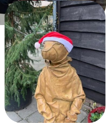
En Zippy wenst iedereen een lekker lui 2025 toe!