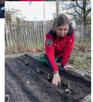
Tessa plant tuinerwten